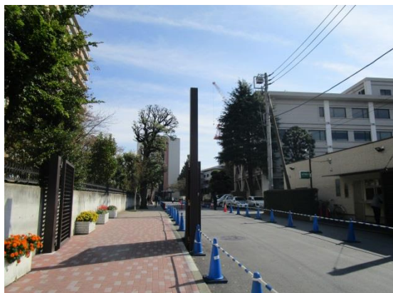
正門からの構内風景

ら入るため、手前で左折しますが、直進して駒沢交差点を左折して正門から入ります。直進して右側の学生会館脇を下ると学食の建物があります。写真下右の1F（平日の営業時間8時～19時）と階段を上り2F（平日の営業時間11時～19時）が学食です。