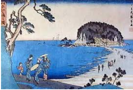
歌川広重 (1797 年~1858 年)