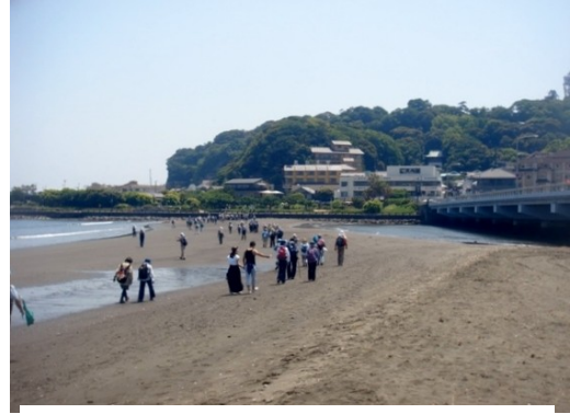
2017 年 5 月のウォークメイト例会

ところで、江ノ島を日本のモン・サン・ミッシェルと称したのは、ワシントンのポトマック河畔の日米友好の桜を植えることに尽力したシドモアで、その著「シドモア日本紀行」の江ノ島の項の中に日本版モン・サン・ミッシェルと書いているとのことである。宮島のある甘日市市は目ざとく 2009 年モン・サン・ミッシェルと観光友好都市提携をしている。もともと同じころ、片瀬海岸は東洋のマイアミ・ビーチと宣伝していた。モン・サン・ミッシェルの名物はオムレツ、宮島は紅葉饅頭であるが、江ノ島の名物は何？、生シラス、夫婦饅頭、海苔羊羹、タコ煎餅である。