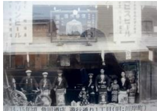
川岸町（現藤沢 692）にあった中島屋角田商店。大正 14, 15 年頃の撮影の写真 看板には優等清酒 神聖 京都伏見 山本源兵衛とある。ガラス越しに撮ったので不鮮明です。

買う＝女。旅籠屋には飯盛女（表向き給仕する女）を置かない平旅籠もあったが、多くは飯盛女を置き売春を前提に旅籠屋に抱えられていた。幕府は公認の遊郭（江戸の吉原、京都の島原）以外に遊女を置くことを禁じたが、飯盛女は遊女と区別されその存在は黙認されていたが、享保和 3 年（1718）幕府は、旅籠屋には飯盛女を 2 人以上は置かないと規制。その後、再三注意したが、文政 8 年、藤沢宿など 5 宿は関東向取締役へさらに誓約している。衣類は木綿以外は着用させない。旅人を勧誘したり、多額の金銭を要求しない。宿内の者、助郷人足、近在の者は宿泊させない。藤沢宿には江戸表、近在から江ノ島に参詣に来る者が多いが食売女（飯盛女）を先々まで遣わして出迎えしない等 10 カ条を提出した。天保 6 年（1835）当時、旅籠屋 45 軒うち、27～28 軒が飯盛旅籠屋であったとされ 56 人の飯盛女いたと計算されるが、実際は家事手伝い、子守などの名目で 2 倍位、100 人程度の飯盛女がいたとされている。