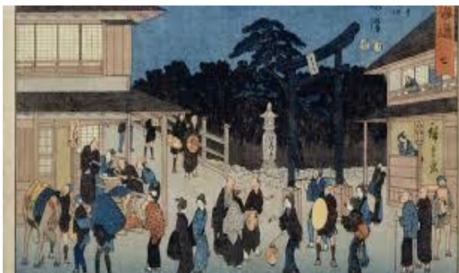
夕暮時、遊行寺橋付近で客引きする女が見られる

買う＝女。旅籠屋には飯盛女（表向き給仕する女）を置かない平旅籠もあったが、多くは飯盛女を置き売春を前提に旅籠屋に抱えられていた。幕府は公認の遊郭（江戸の吉原、京都の島原）以外に遊女を置くことを禁じたが、飯盛女は遊女と区別されその存在は黙認されていたが、享保和 3 年（1718）幕府は、旅籠屋には飯盛女を 2 人以上は置かないと規制。その後、再三注意したが、文政 8 年、藤沢宿など 5 宿は関東向取締役へさらに誓約している。衣類は木綿以外は着用させない。旅人を勧誘したり、多額の金銭を要求しない。宿内の者、助郷人足、近在の者は宿泊させない。藤沢宿には江戸表、近在から江ノ島に参詣に来る者が多いが食売女（飯盛女）を先々まで遣わして出迎えしない等 10 カ条を提出した。天保 6 年（1835）当時、旅籠屋 45 軒うち、27～28 軒が飯盛旅籠屋であったとされ 56 人の飯盛女いたと計算されるが、実際は家事手伝い、子守などの名目で 2 倍位、100 人程度の飯盛女がいたとされている。