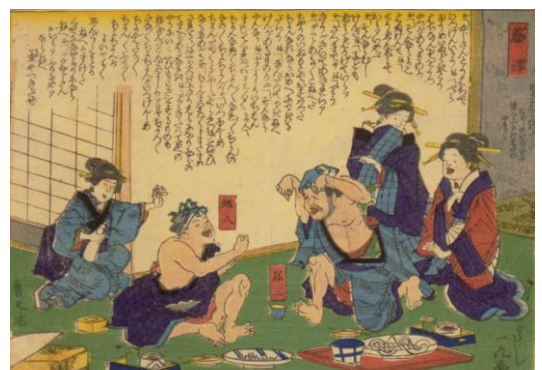
東海道中膝栗毛、藤沢宿での弥次喜多