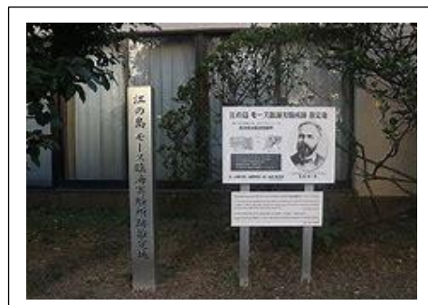
モース 臨海実験所跡推定地碑

江ノ島弁天橋を渡ると左側に観光案内所があり、前面の海側一帯は北緑地という広場、オリンピック記念噴水池、モース記念碑がある。石の台座には日本近代動物学発祥の地の銘板がある。また観光案内所内の一角に当時の島の人々の様子や風俗のパネルがあるので、覗いて見るとよい。モースの島での滞在は7月21日～8月28日までの短い間であったが、