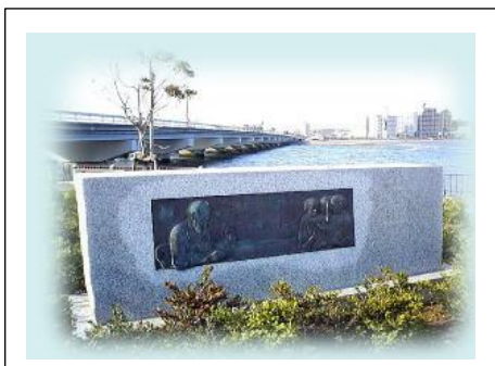
モース記念碑 レリーフ