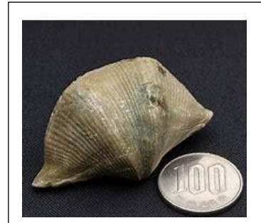
腕足類 サミセンガイ