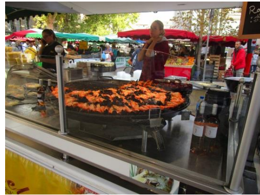
写真上左は野菜、写真上右は大きな鍋のパエリアです。