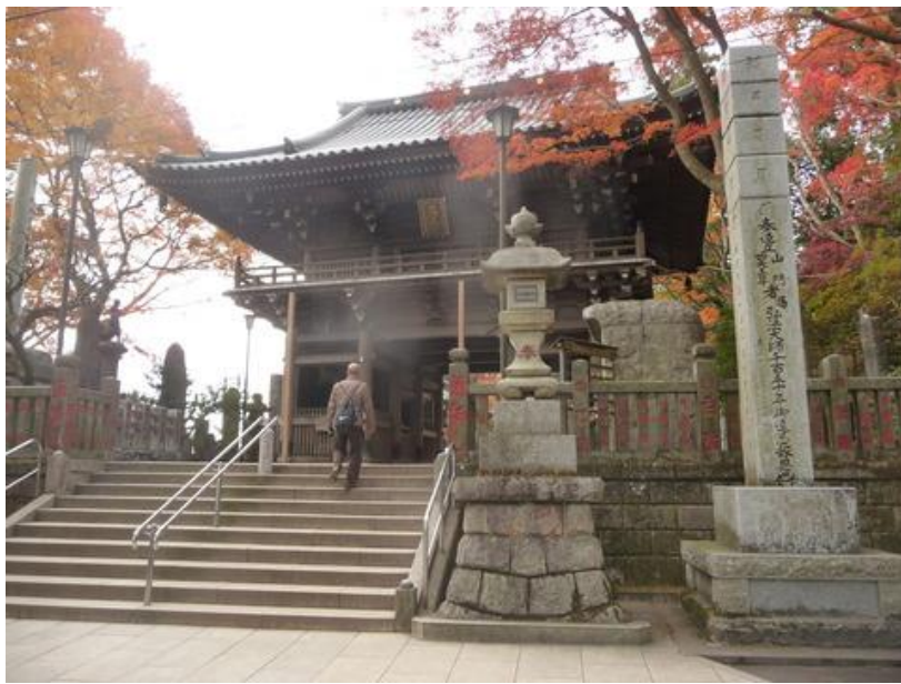
薬王院への山門を潜ると、木々も色づいて来た