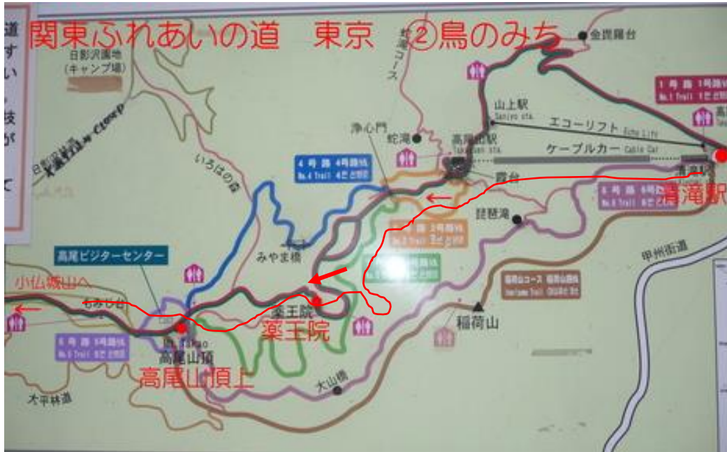
高尾山口駅から高尾山まで概念図

2019年12月6日(木)曇り 寒い やっと雨も上がったので ②鳥のみちを歩く事にした。 今回「②鳥のみち」は一旦高尾山、小仏城山へ出て陣馬山に向かうのであるが、城山までのコースは、前回の「①湖のみち」と同一ルートであるから面白くない。しかし景信山、堂所山、陣馬山から陣馬高原に出る道は桜の咲く頃となれば、関東ふれあいの道でも屈指の人気コースであると言う。残念ではあるが、今日は冬枯れの寒い日に歩く事になってしまった。