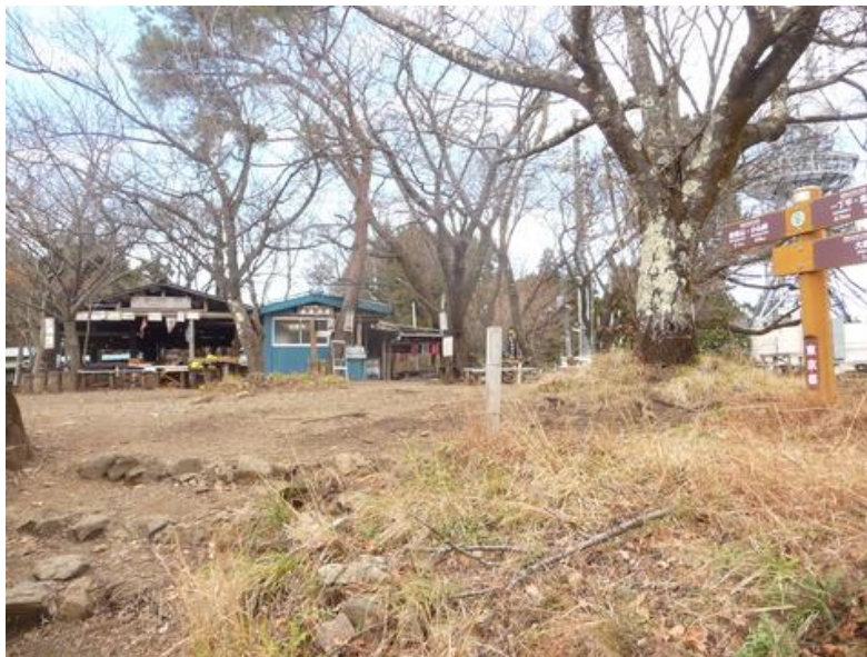
「小仏城山 (670m)」 10:00 着、人はいないね、茶店の人もまだ来ていない