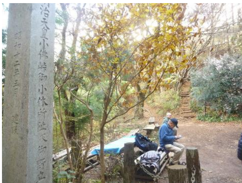
「小仏峠」旧甲州街道の峠道。明治天皇が全国巡行の砌、ここで野立てをした所