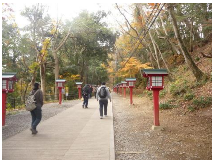
京王電鉄寄進の常夜灯を頼りに薬王院に向かう