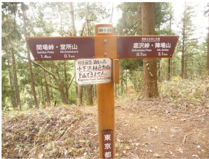
小下沢へ下る道も林道崩壊で通行止めとなっている