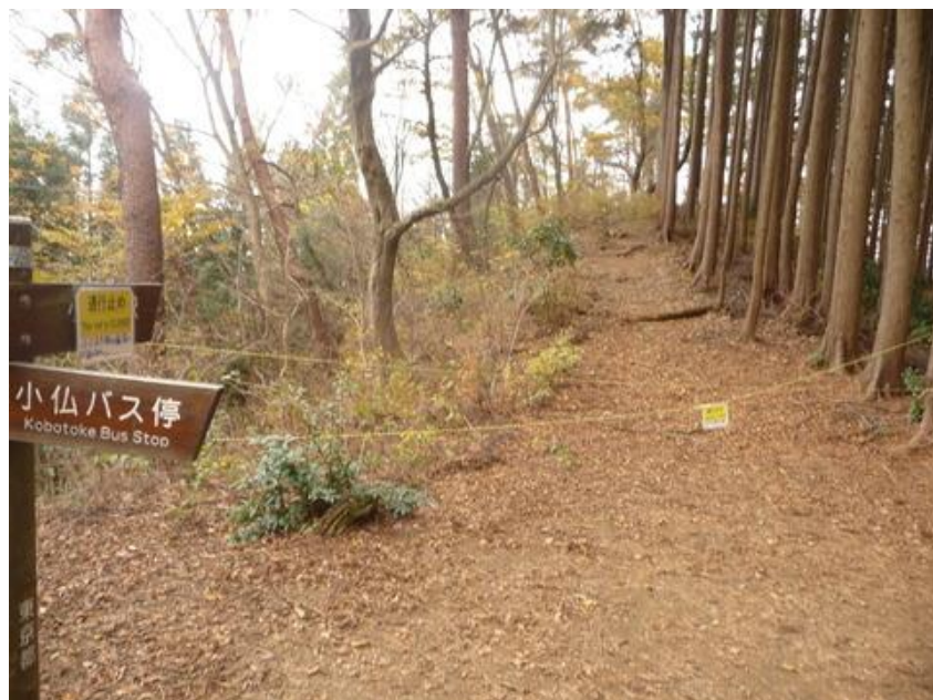
再び景信山に戻り、ここから小仏バス停に戻る事にする