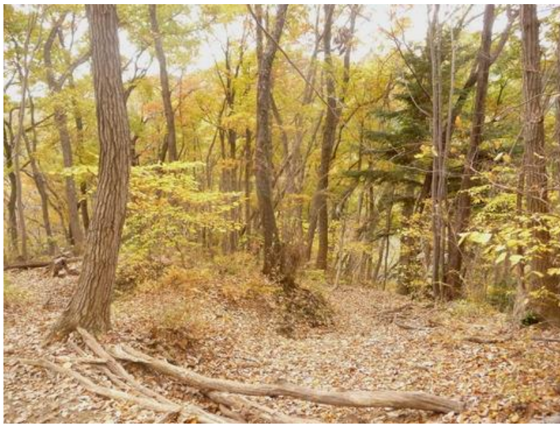
馬鹿にできない素敵な雑木の尾根を一気に下る