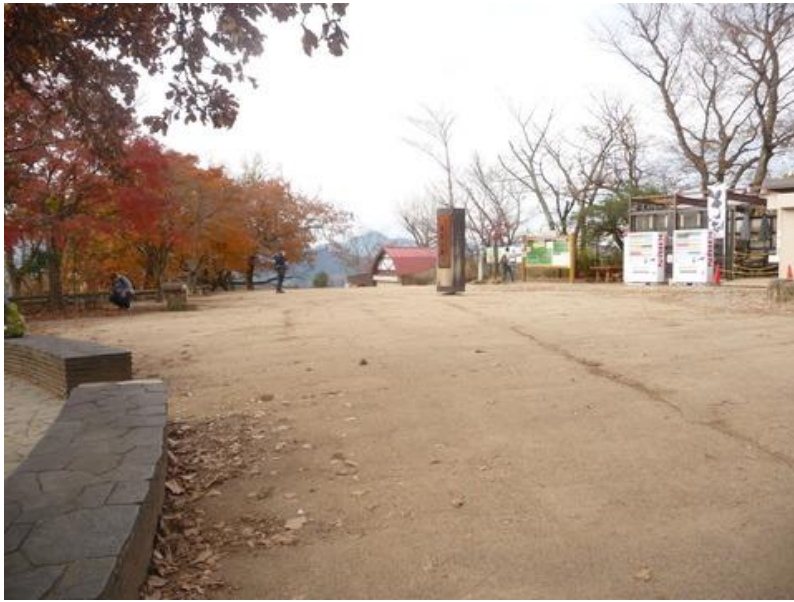
「高尾山頂上（599m）」朝の8時であれば人も少なく、茶店も開いていない