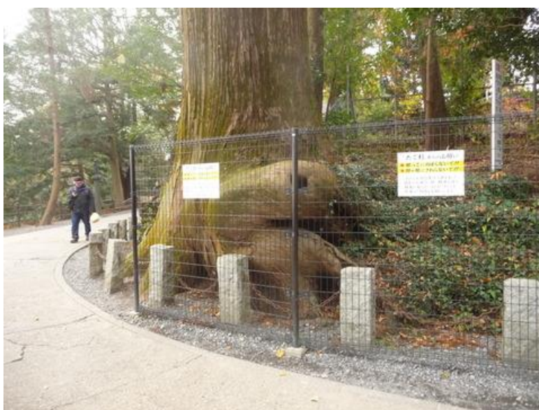
ケーブルを降りて高尾山に向かう途中に「蝸杉」がある。 樹齢 450 年と言うから、江戸時代の初めに植えた杉だね、高さ 37m、目通り 6m