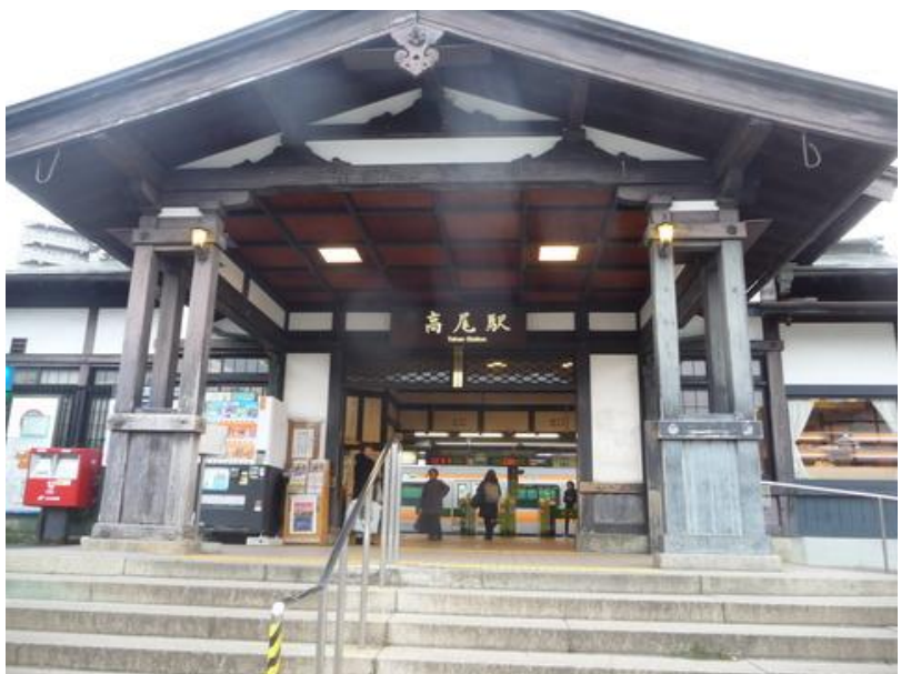
「JR 高尾駅」JR にはユニークな駅だね、明治 34 年中央線浅川駅として開業、昭和 36 年「真言宗高尾山薬王院有喜寺」から高尾と改称した。