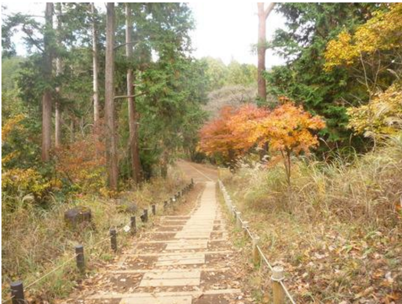
休まず一気に小仏城山に向かう