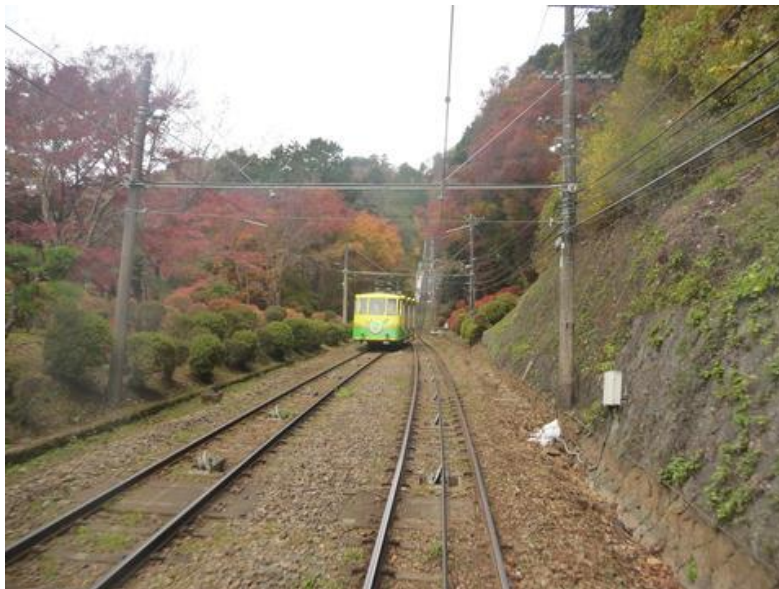
今年は暖冬のせいか、紅葉が遅い気がする