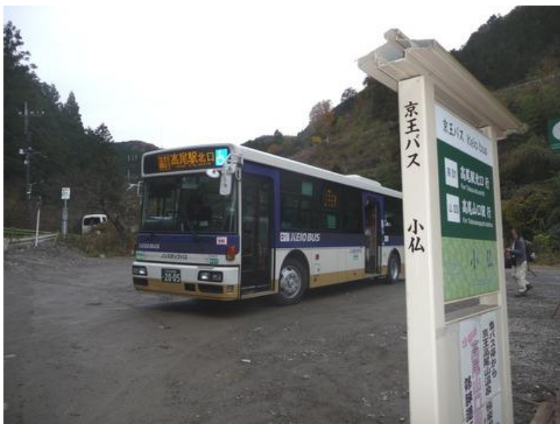
景信山から 40 分程で到着する、バスは一時間に二本出ているから安心できる