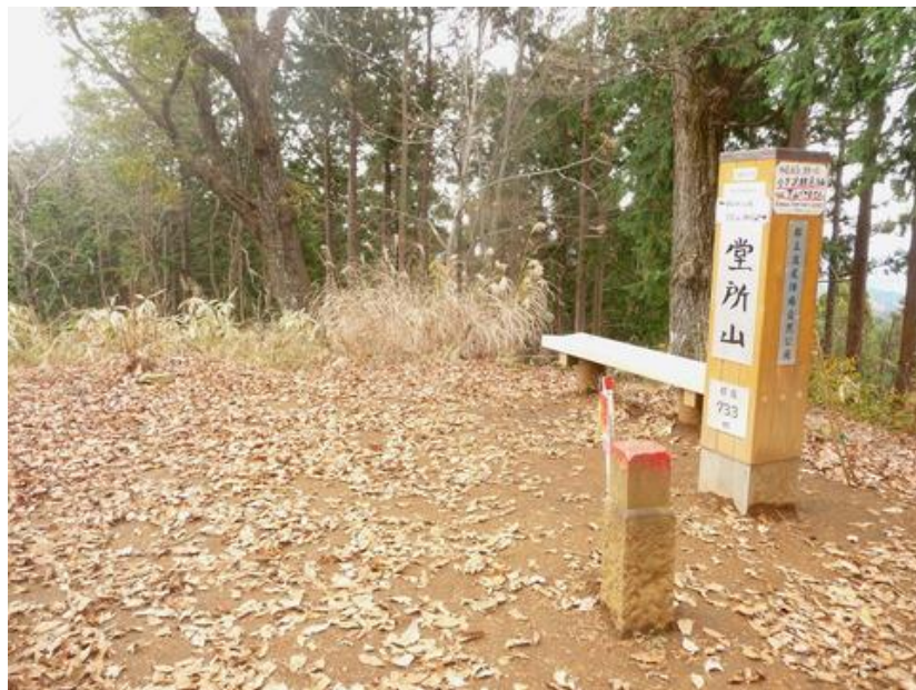
「堂所山（731m）見通しはあまり利かないがここまで1時間、快適な尾根の散歩が出来た。