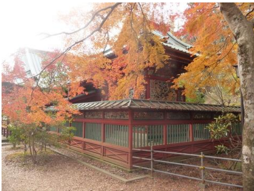
ここまで来ると、紅葉も美しい色合いになっている