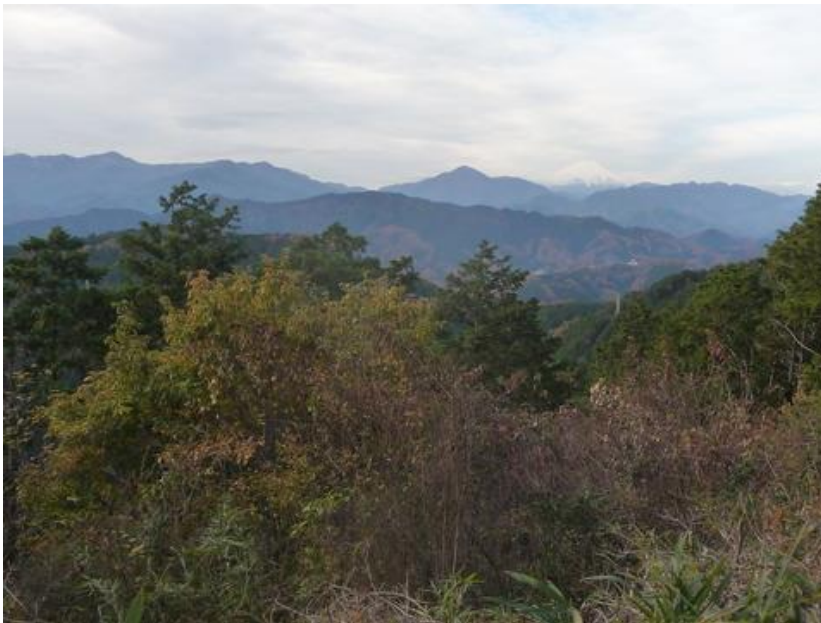
曇りベースであったが富士山が見えた