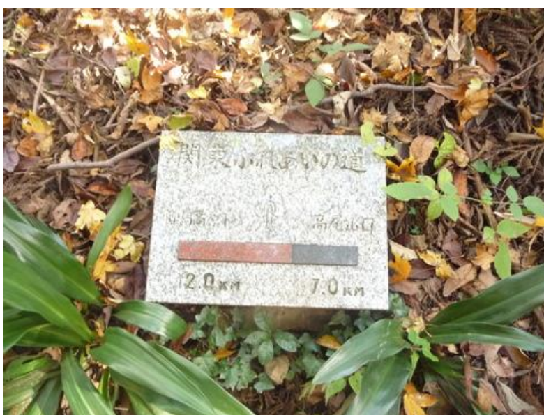
路傍に里程標があった、陣馬高原まで 12 km もある。ひっそりと置かれているのが嬉しい