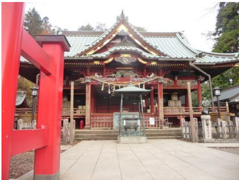
「高尾山薬王院」朝が早ければ参拝者も居ないから、落ち着いてお参りが出来る