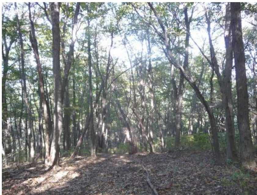
冬の雑木林も弱い日差しを受けて、午前中なら暖かく歩ける