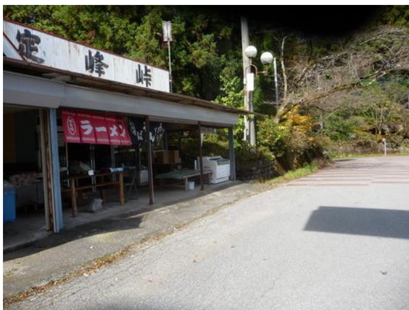
街道要衝の地であるから、大きな茶店もあり自動車、バイクの駐車場もある