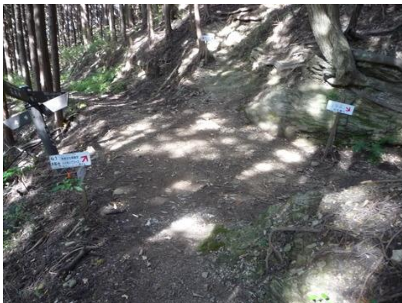
「旧定峰峠」昔の旅人はここを利用した。自動車道が出来るとこの峠道は急速に廃れてゆく