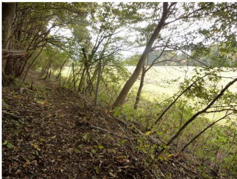
ここからは、高原牧場の縁を回り込むように下ってゆく