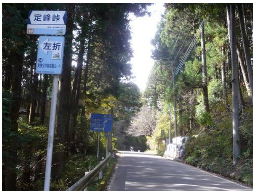
この道は秩父地方から寄居、川越方面に出る重要な道となっている