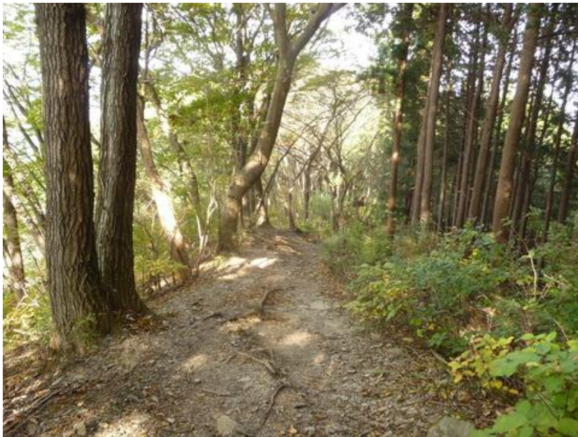
下りはそれ程急坂ではなく、穏やかな尾根を下る