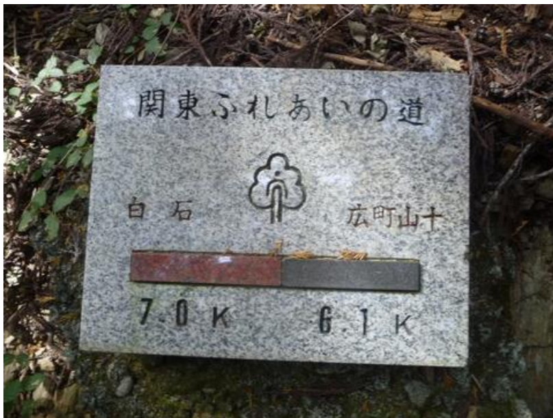
此の辺りで丁度半分か（広町山十は、旧町名でいまは「高原牧場入口」となっている）