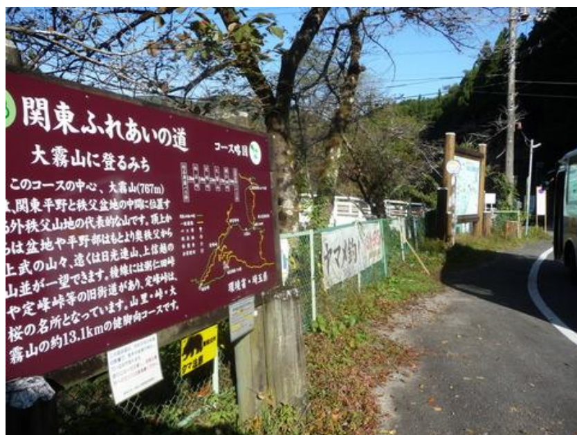
バス停前には関東ふれあいの道案内板があるから、確認して行こう。