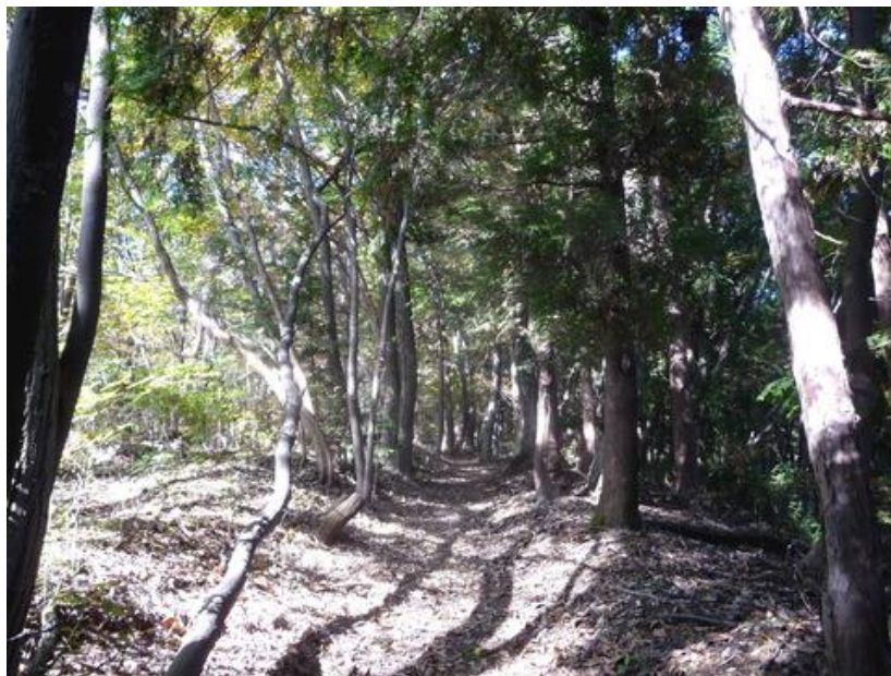
適度な登降を繰り返しながら、快適な尾根道を歩く