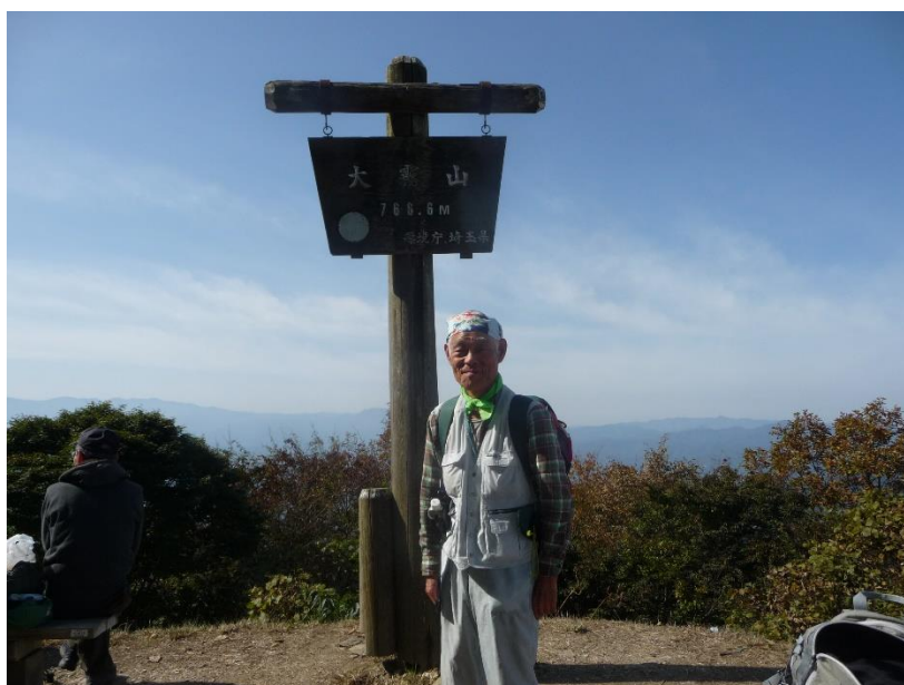
「大霧山（767m）」二等三角点が立つ見晴らしが良い頂上。快晴であれば奥多摩の山、上州の山が良く見える