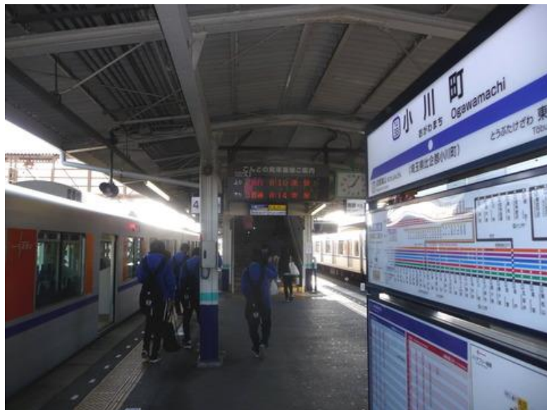
今日の鉄道最寄り下車駅は、東武東上線 小川町駅