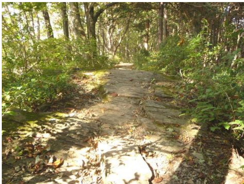
秩父古生層の岩盤の上を歩く、石が少し緑かかっているから、緑泥片岩かな