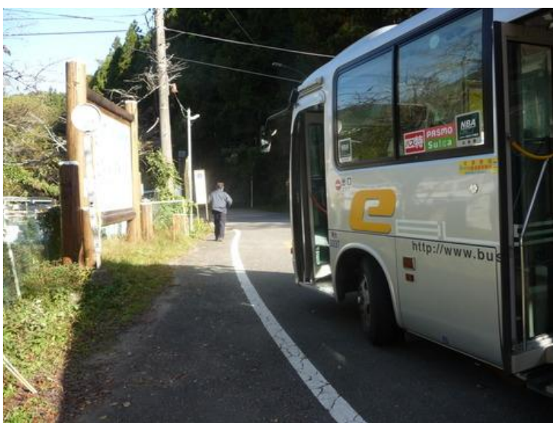
駅前から白石車庫行のバスに乗り、終点で降る。このバス路線、2019年10月の台風19号で道路が崩壊して不通であったが、先月10月20日やっと運行再開されたばかりなのだ