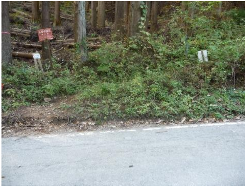
何度か定峰峠に行く自動車道を横断しながら、登山道は峠に向かう