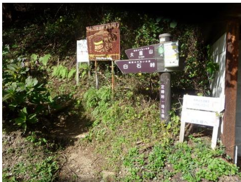
道は北へ大霧山目指して登行する