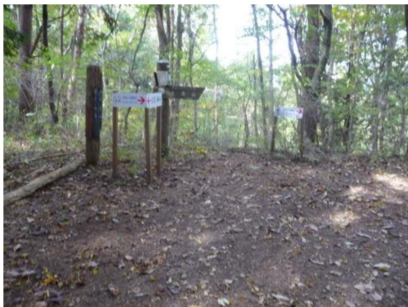
また数回小ピークを越えると