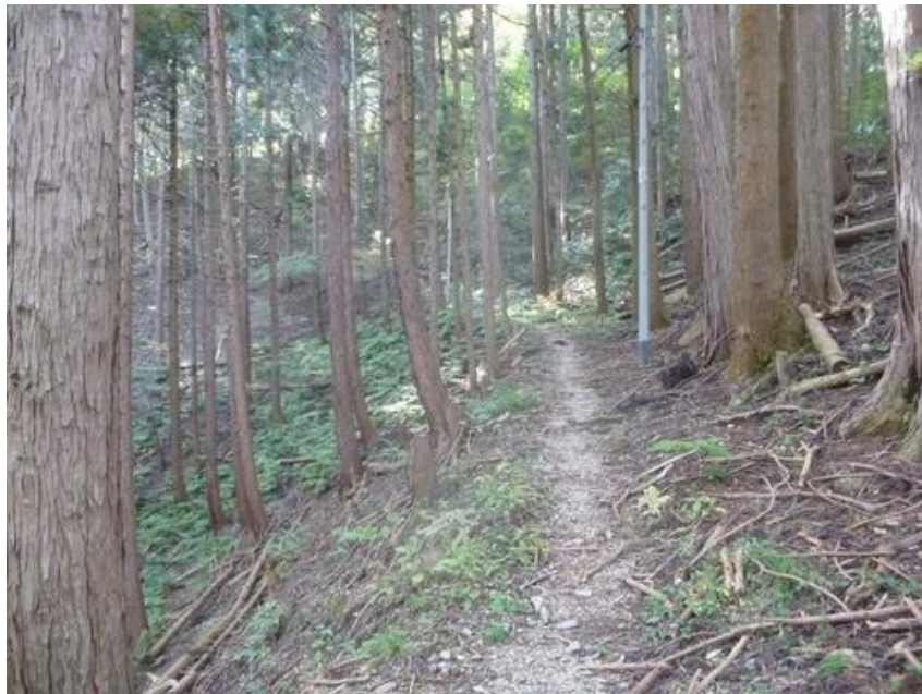
今回のウォークは白石峠に行かず、直接定峰峠に直登するルートを選んだ。