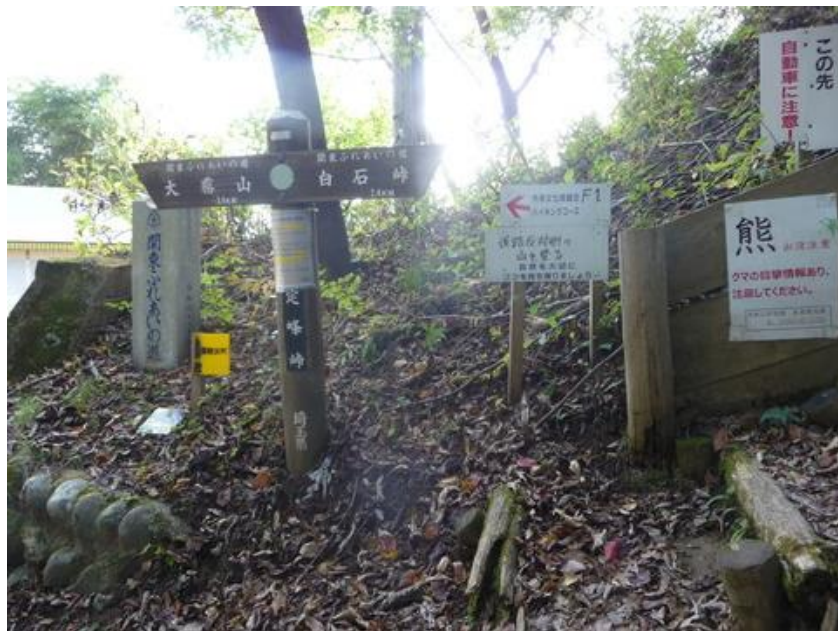
白石峠から来る関東ふれあいの道と合流、ここにも熊が出るとの表示だ