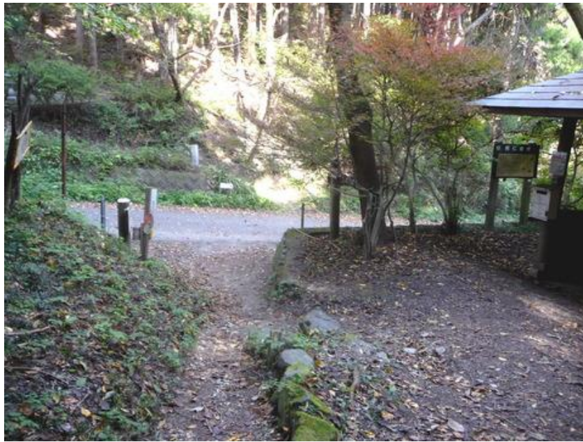
頂上から 30 分程で粥仁田峠に到着、ここも秩父から関東に出る主要な道だ