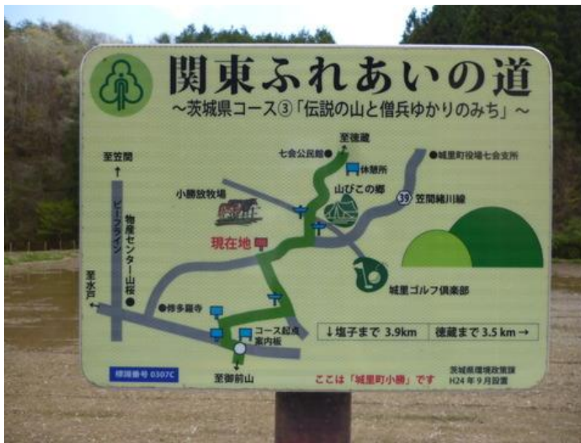
木製の道標に変えて新しいミニ案内板は分かりやすい