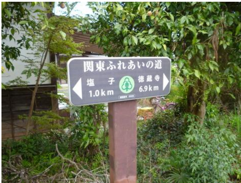
山間の谷あいに来た狭い林道に入って行く