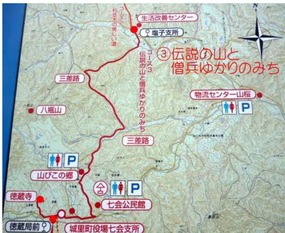
「③伝説の山と僧兵ゆかりのみち」地図