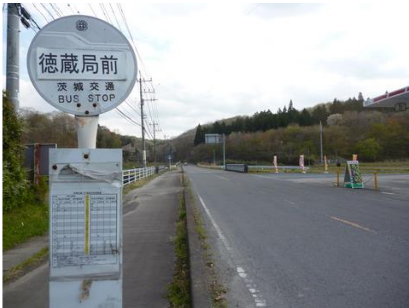
徳蔵郵便局前バス停にゴール。平日の月曜日は 16:46 発。火～金までは 17:46 発のみ。土曜、休日、学校が休みの場合は運行しない、これでは路線バスでなくスクールバスだ。