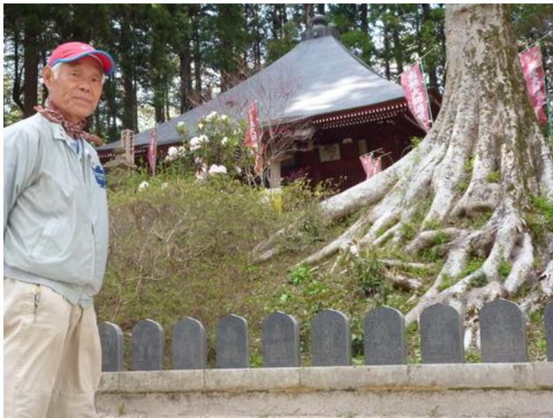
私も参拝記念に一枚パチリ