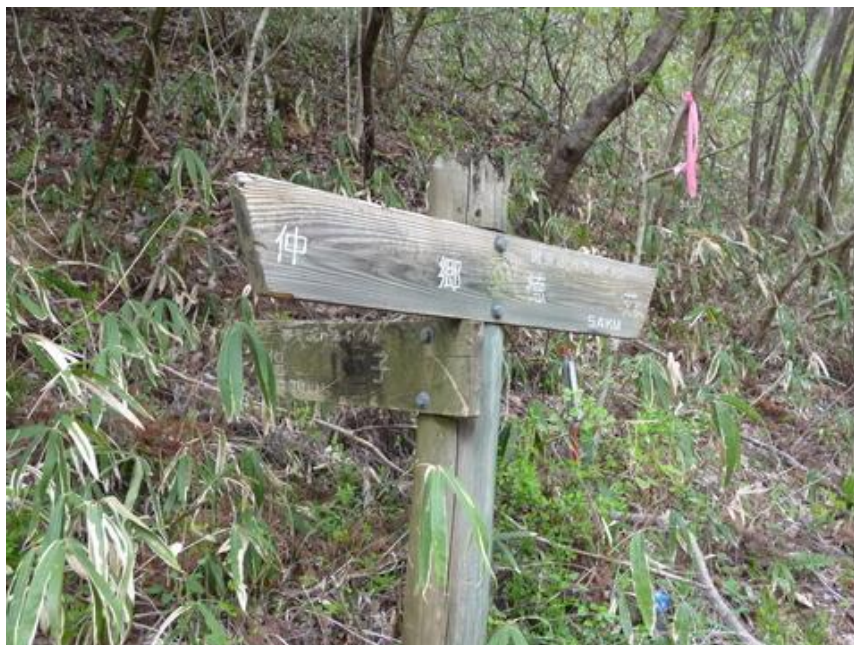
もちろん昔ながらのものもある