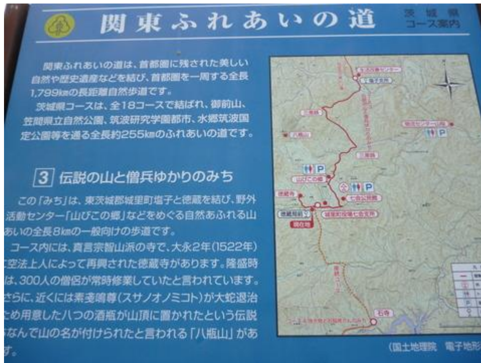
「③伝説の山と僧兵ゆかりのみち」案内板 (首都圏自然歩道連絡協議会)

午後はここから歩き繋いでゴールの徳蔵郵便局前まで歩く、距離は7.2kmであるから3時頃には着くだろう、バスは16:46発が平日一本あるが一般的ではない。スクールバスであるから、学校休みの場合は運転しない。