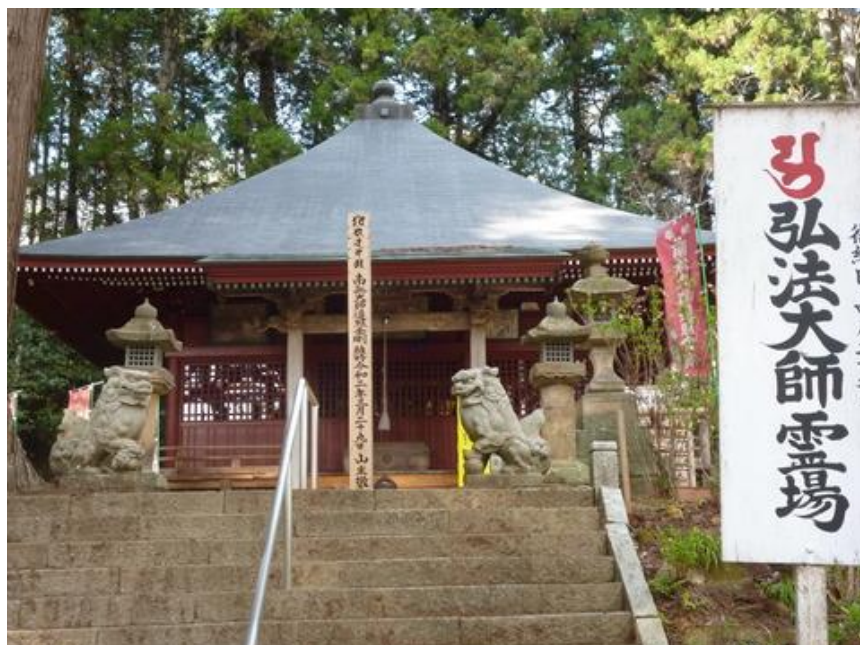
「大師堂」 戦火で焼け残った柱で堂宇を築いたと言う