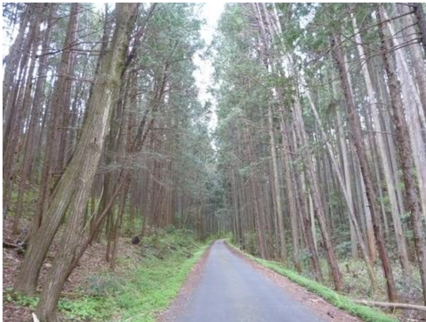
全体に林が痩せて、木がひよろひよろしている