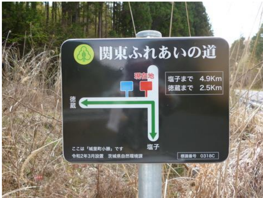
交差点での案内板は、色刷りのアルミ製で素敵な道標だ