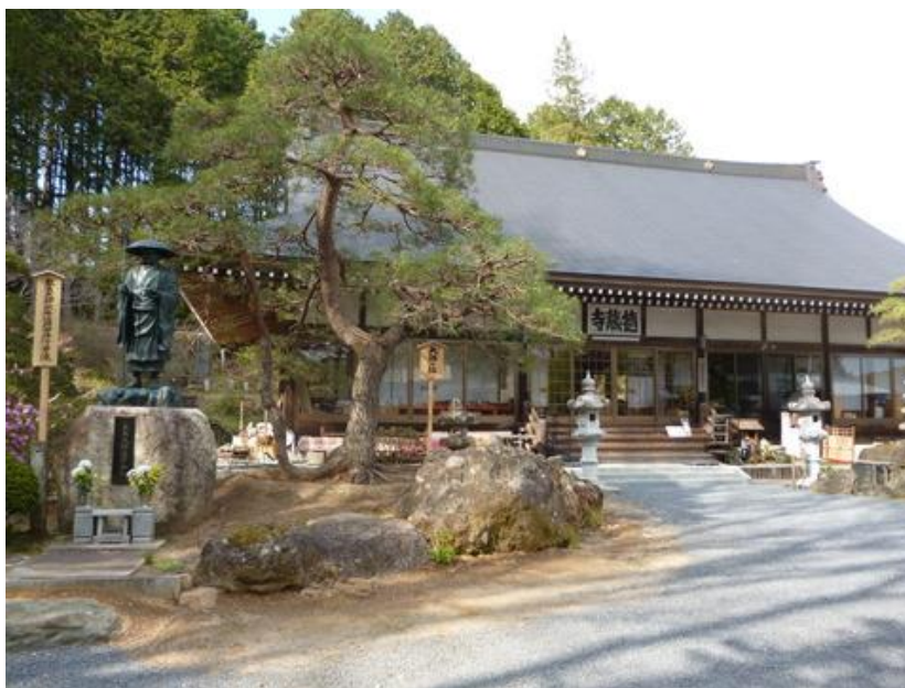
「徳蔵寺」真言宗智山派 大永二年(1522)再興

ここも弘法大師ゆかりの寺で、最盛期には僧坊300余を有し、堂塔伽藍が八瓶山一帯に散らばっていた古刹であったが、戦火により全てを失った