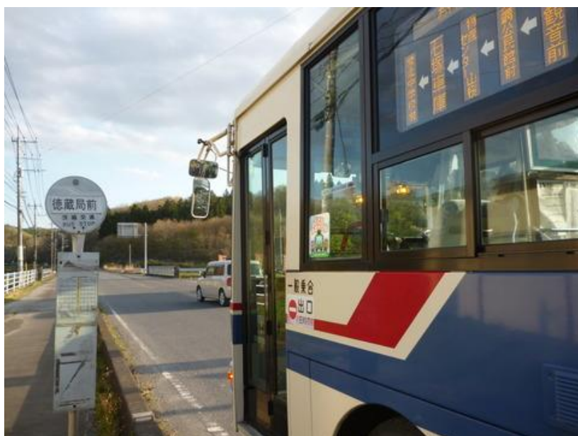
バスが待てない場合、タクシーで笠間駅まで約 6 千円との事。日が西に傾いたころやっと来た (タクシーは徳蔵局前で待っていると伝えれば来てくれる、迎車料金無し柏タクシー0296-72-1206)