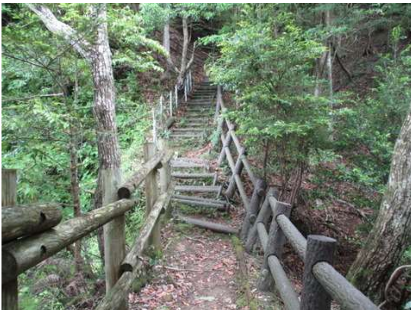
このくらいの破損は、普通