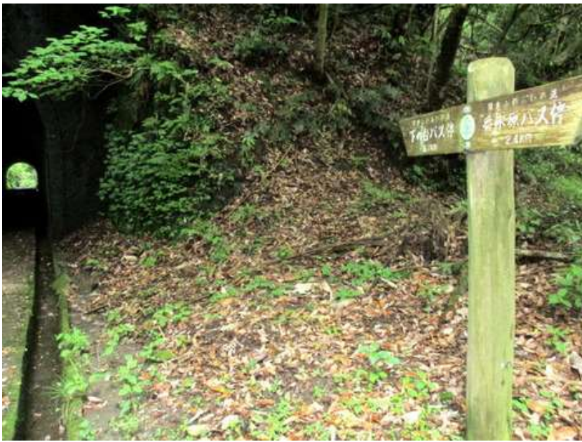
このコース、大きな尾根を 2~3 越えるので、小さなトンネルが数か所ある