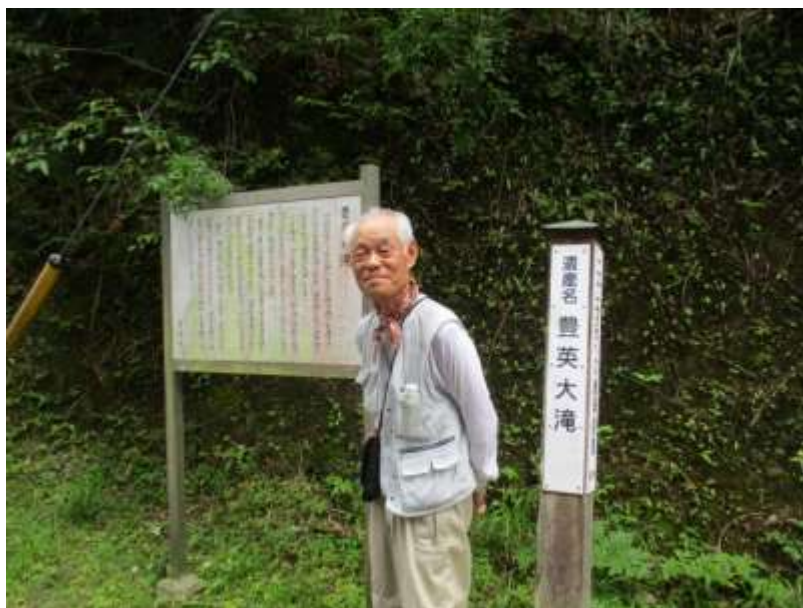
折角ここまで来たのだから、記念に一枚 パチリ