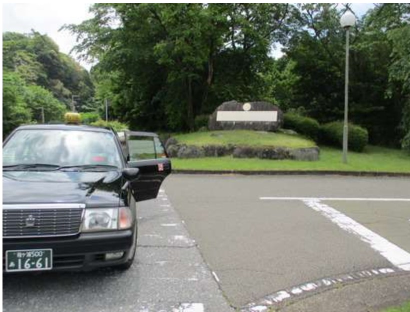
「㉔もみ・つがのみち」ゴールは鴨川市であり、今回の「㉔滝のあるみち」コースは君津市となり、市を跨いだバスの便はない。結局タクシー利用となった(2800円)