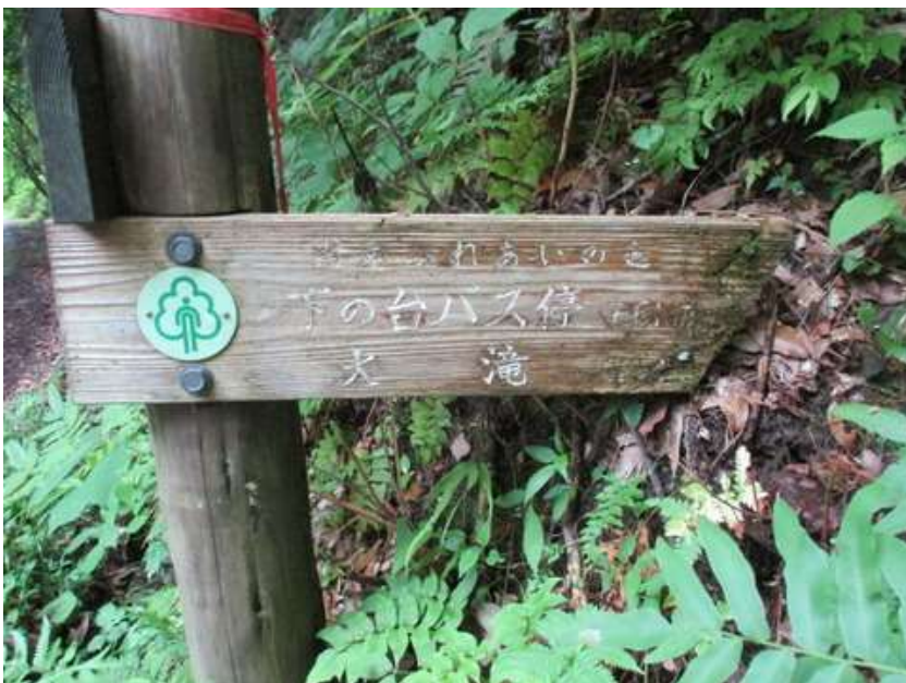
大滝への案内が出て来た、先端が腐って文字が読めない