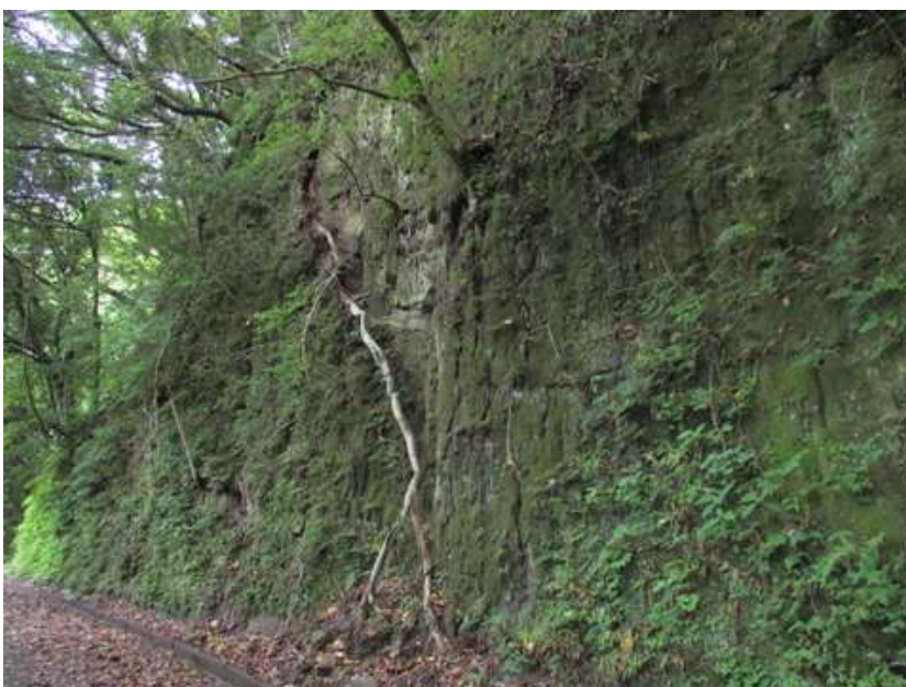
太古の崖もここでは崩れておらず、無事通過出来た