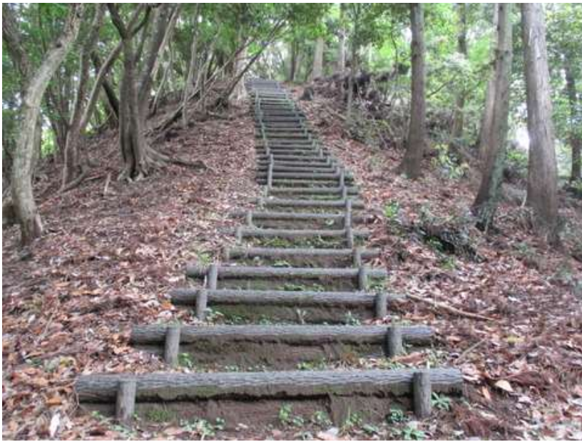
東海自然歩道、関東ふれあいの道共通の長い木枕の道を通り