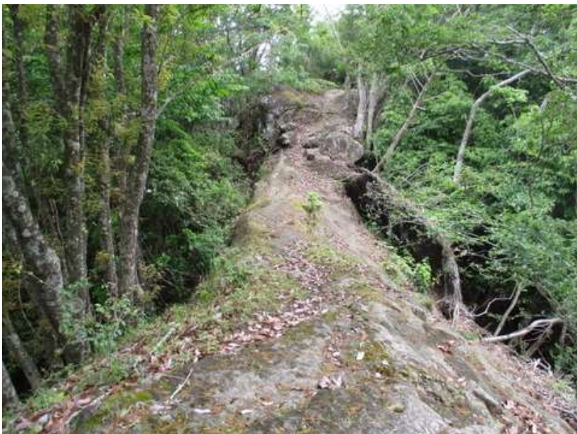
痩せ尾根を通り抜けると