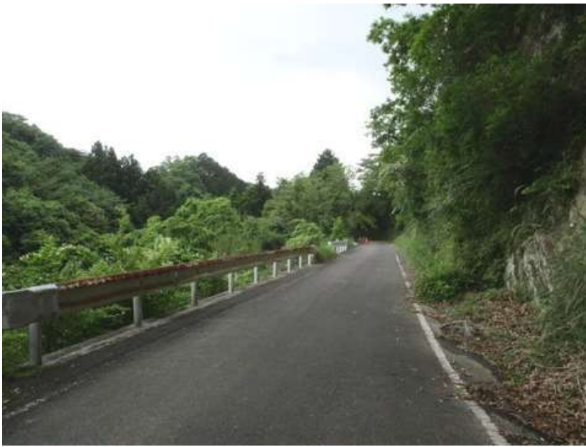
やっと明るい開けた林道に出た