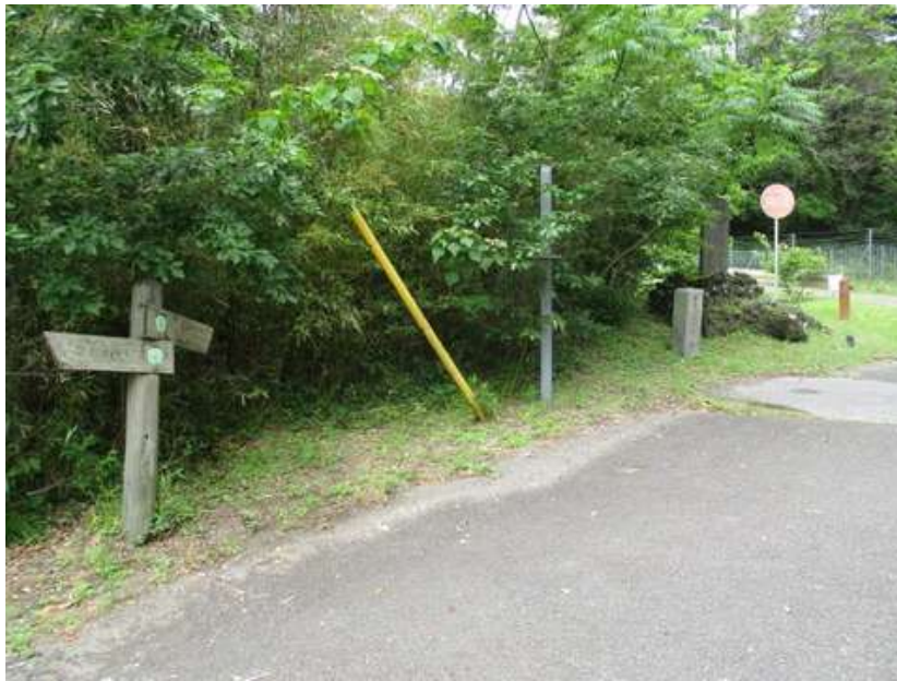
少し蒸し暑かったけど、薄曇りで歩きやすかった。道標もしっかりしている