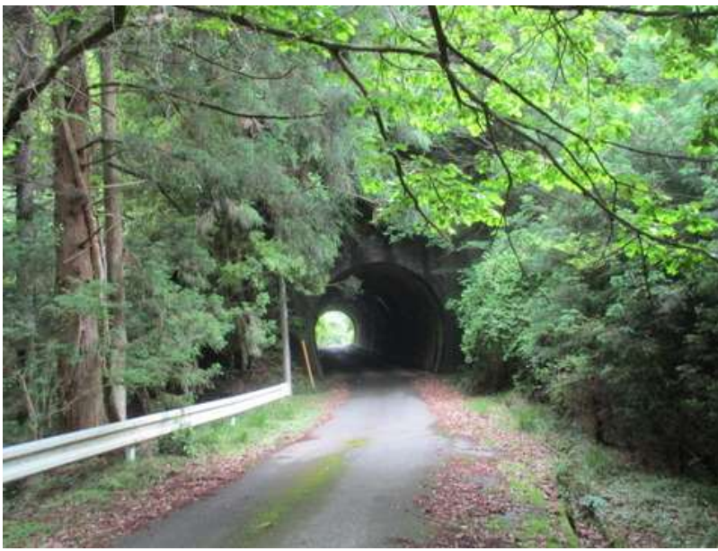
滝を出ると、またしばらく寂しい林道を歩く