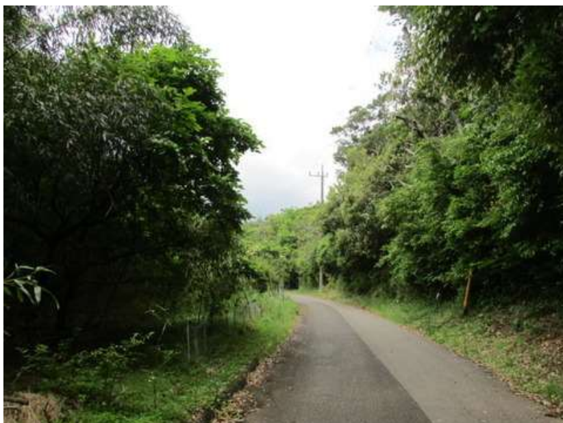
平坦な林道であるから工事中でもなく、がけ崩れもなく、支障なく歩ける