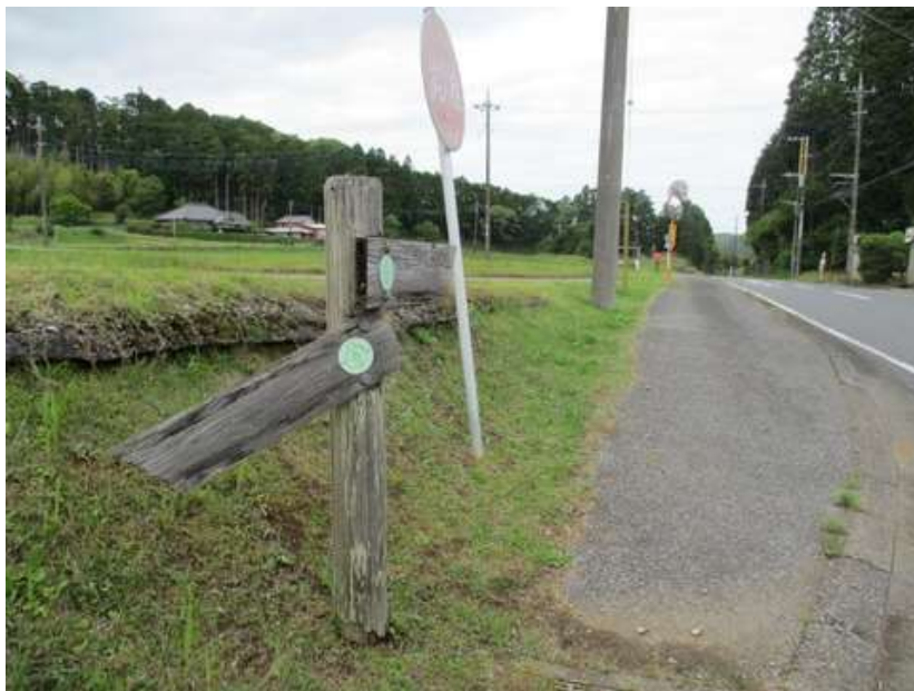
国道 410 号に出る。役目を果たせない道標であるが、方角が合えば大丈夫