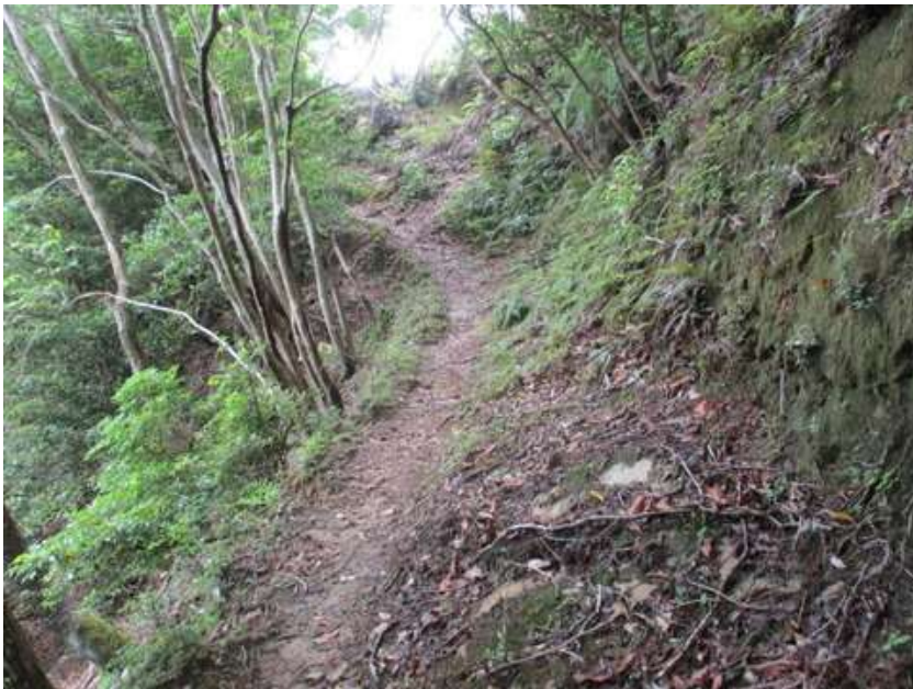
崩れ落ちた崖をへつり