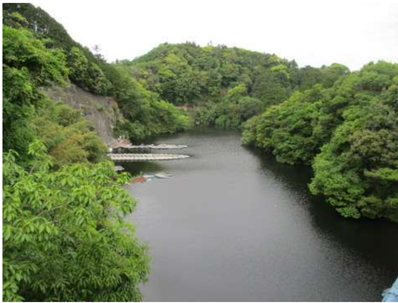
豊英湖を 2~3 の橋で渡って湖を横切る