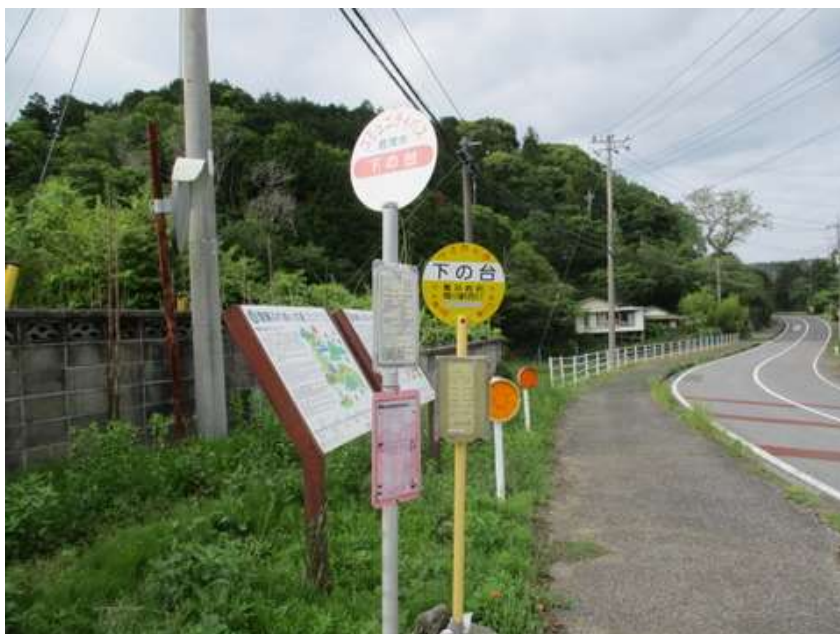
下の台バス停に 15:40 に到着。バスは 16:58 まで無いからホテルに電話して、送迎してもらった。