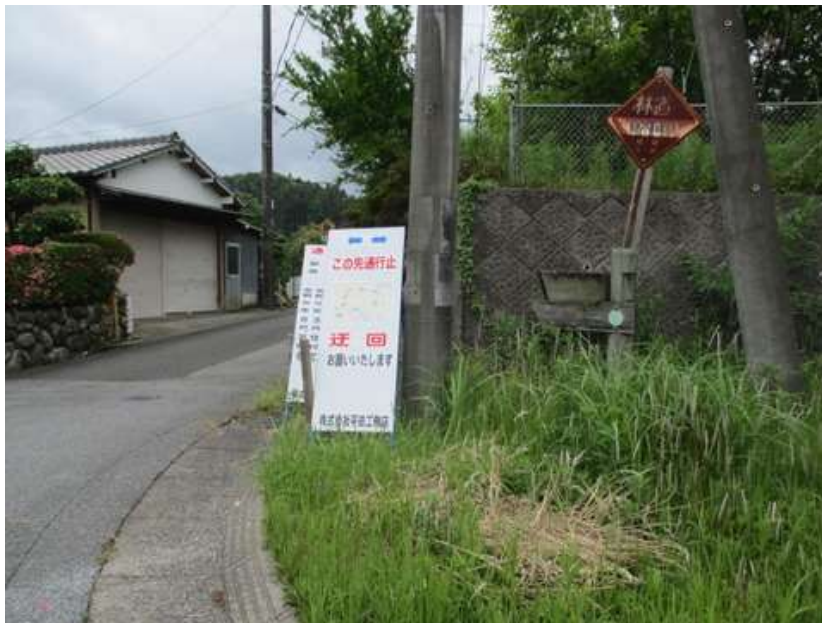
香木原ゴルフ場近くの、旧香木原バス停が今日のスタート地点。林道は通行止めとなって居るが...