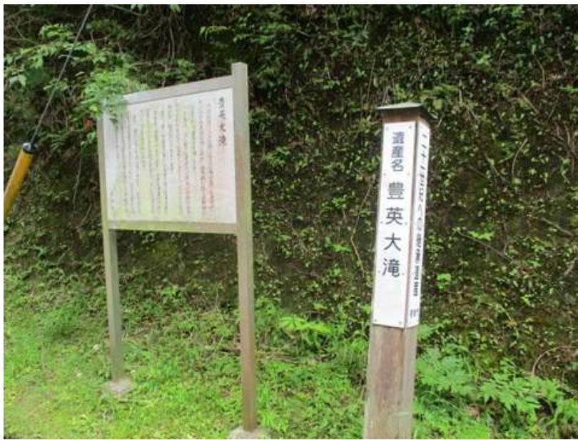
豊英大滝に出た、案内には 21 世紀に残す遺産と記されている