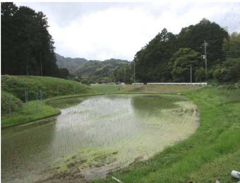
やっと開けたダム湖の集落に着いた。ここは木和田と言う集落で