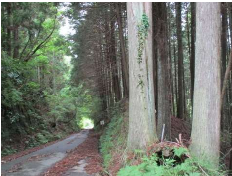
山が深い感じがして、一人で歩くと、うら寂しく陰気なコースだ、