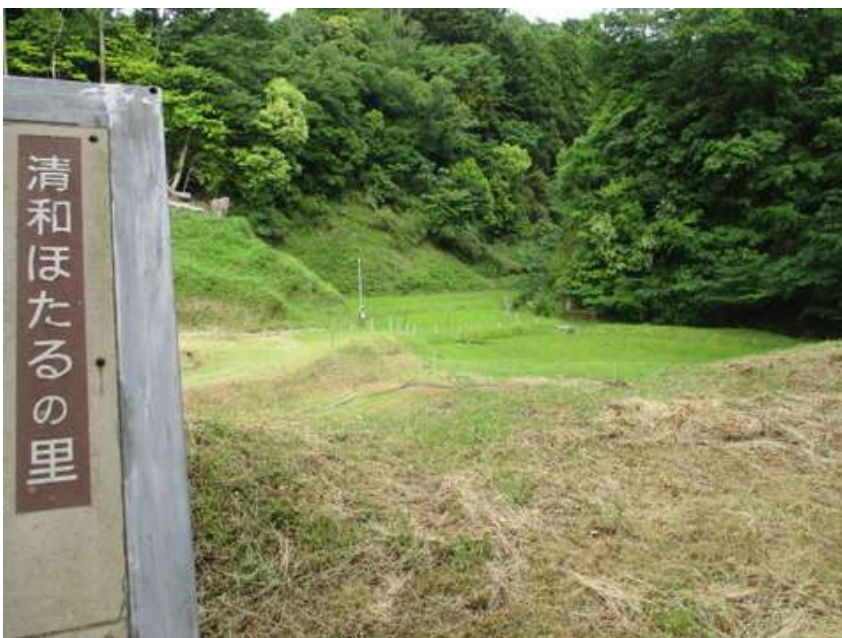
ホタルを大切に育てている里だと説明にあった(清和県民の森)