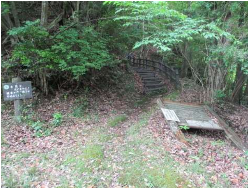
と、思った瞬間、また山道に入る、案内板は朽ちて倒れている