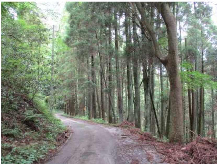
久しぶりに森林浴を楽しむ、もちろん車も人も来ない